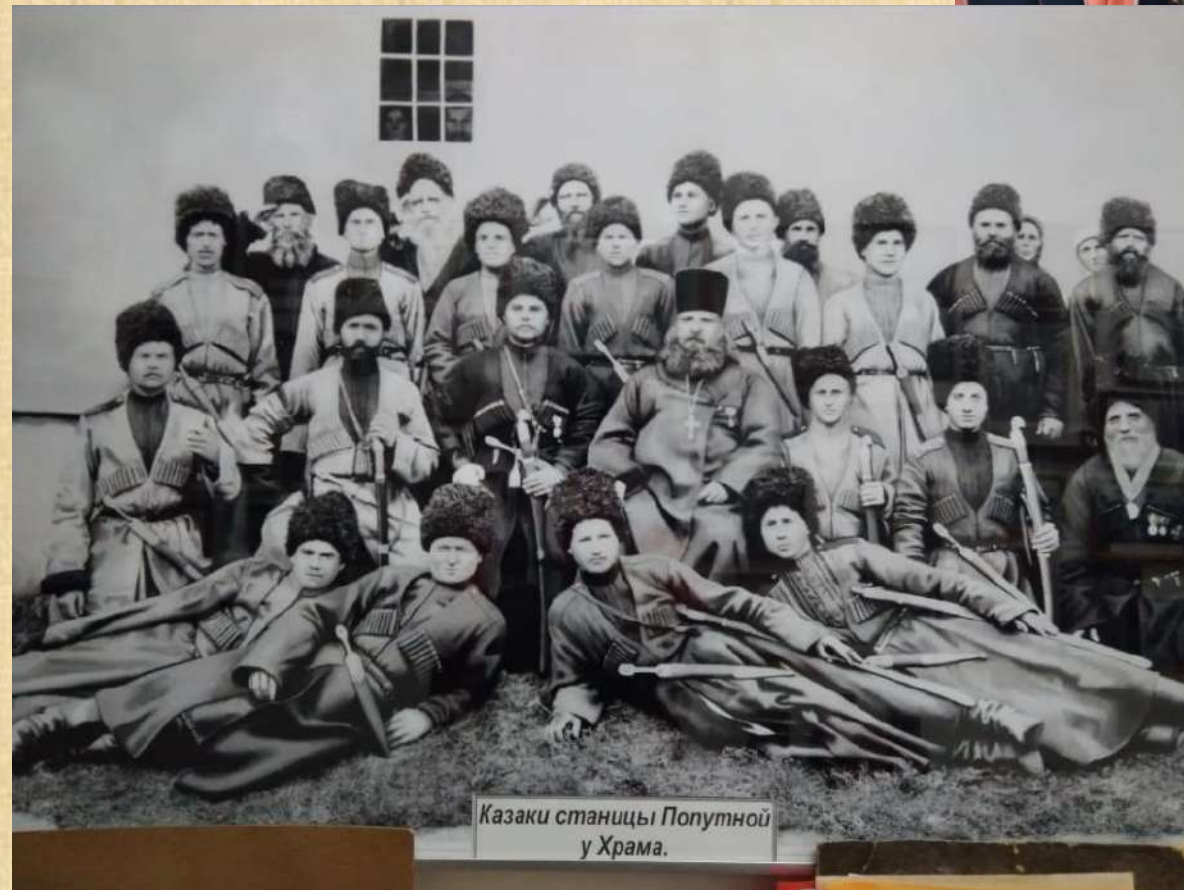
Казачи станицы Попутной у Храма.